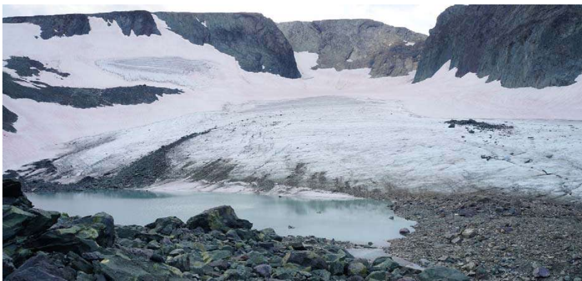
Рис. 1. Ледник Иган. 23.08.2018 г.